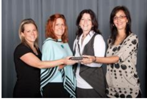
École du Soleil-Levant, Mascouche

Ce prix a été décerné à l'école du Soleil-Levant pour souligner leur participation exceptionnelle au Concours québécois en entrepreneuriat Lanaudière. Chaque année, l'implication des enseignantes a permis le dépôt de nombreux projets dont plusieurs ont été lauréats. Leur dévouement a contribué de façon significative au développement de l'entrepreneuriat étudiant.