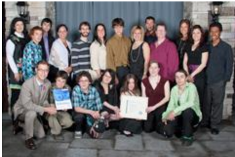
Les gugusses du Perdu