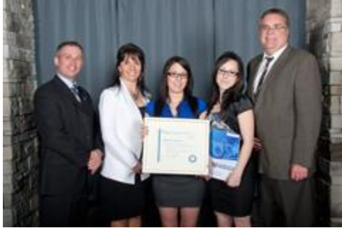
Soirée bénéfice MIRA Noir & Blanc

Cégep régional de Lanaudière à Terrebonne