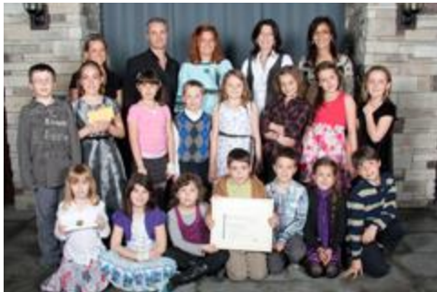
Un chiffon pour de bon!